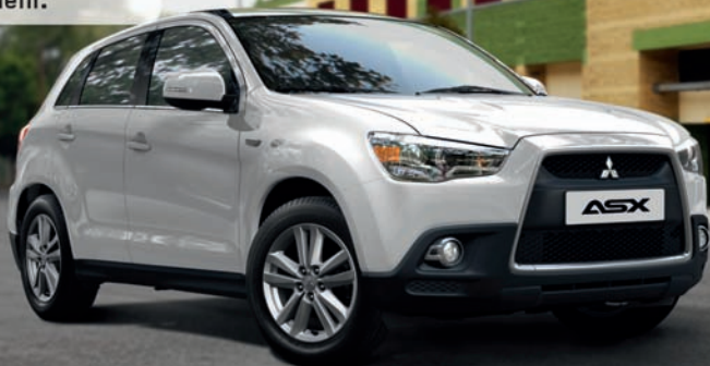
Abb.: ASX „35 Jahre“

MITSUBISHI ASX 1.6 "35 Jahre" 2WD 2 AB 21.690 €