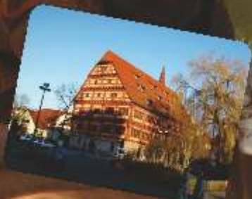
Historisches BierkulturStadt Ebingen (Donau) Geöffnete sonntags von 11:00 Uhr - 17:00 Uhr