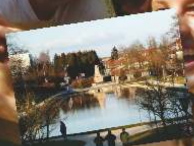
Historische BierkulturStadt Ebingen (Donau) Länder (Kultur) verbindet