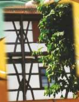
Trinken des Qualitätsbieres in dem Schönen Biergarten (Ebingen) Rückwärts in Richtung der Kulturstadt Ebingen

Ein Besuch in der BierkulturStadt Ebingen (Donau) lohnt sich, doch noch viel mehr lohnt es sich mindestens einmal unsere Permanenten IVV-Bierwanderweg. Wir wandern von einem Bier zum andern mit drei Strecken zu erwandern.