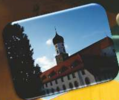
Historische Kloster der BierkulturStadt Ebingen (Donau) heute Musikkirche